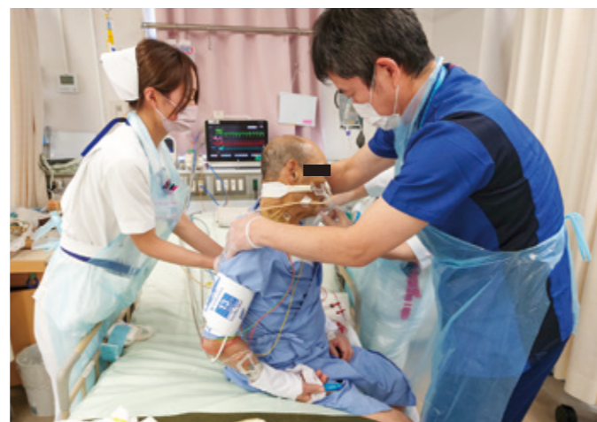
人工呼吸装着中の患者さんの早期リハビリ

当院の集中治療室には、安静臥床が必要な術後急性期や重症の患者さんが多く入室されていますが、早期の離床や人工呼吸器離脱が重要となります。そこで私たち3名の集中ケア認定看護師は、医師、臨床工学技士、理学療法士などと共にRST活動(Respiration Support Team: RST)を行っています。これは患者さんの状態や各種データを基に、人工呼吸器の設定や口腔内の衛生管理、呼吸ケアなどに関して助言を行うもので、早期の離床や人工呼吸器離脱を目指して積極的に活動しています。