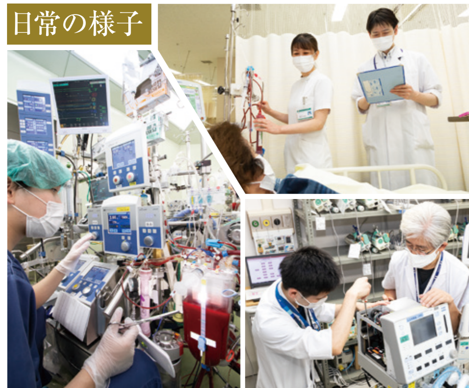
【写真左】 心臓手術を行う際に、心臓と肺の機能の代わりをする人工心肺を操作している様子