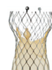
▲コアバルブエヴォリュートR弁